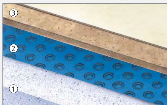
1. Beton 2. Platon Stop Original 3. Spånplade/belægning