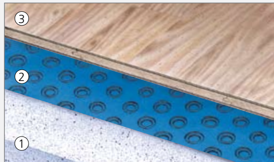
1. Beton 2. Platon Stop Original 3. Parket/Laminat

Med Platon Stop har du mange valgmuligheder med hensyn til overgulv. Husk at Platon Stop er et naturligt førstevalg som underlag for laminat- og parketgulve – og andre trægulve.